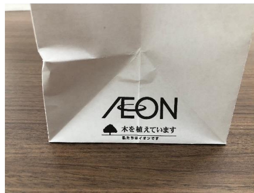
今後、順次導入予定のFSC認証紙手提袋イメージ