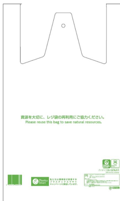
食品・暮らしの品 新しいバイオマス原料配合レジ袋 のイメージ